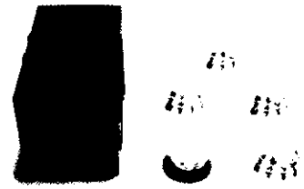
茶吞茶碗 文政12年(1829年)拝領