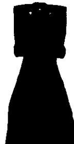
藍麻地角通し小紋上下