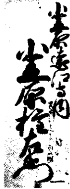
関札 享保11年(1726年)4月27日